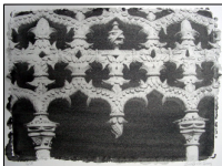
Mosteiro da Batalha. Carlos Sá Pessoa (2004)

Carlos Sá Pessoa (Covilhã, 1950) muestra en su serie fotográfica Intimidad de la Piedra formas que engendran otras formas de hiperrealismo a las que el salto en escala presta una dimensión suplementaria. Formas que se descomponen en otras construcciones de la misma naturaleza, que se superponen en la percepción. Sus fotografías nos invitan a echar un vistazo a la escultura en piedra, la cual se redondea, se angula, creando y deshaciendo superficies y volúmenes, entrantes y salientes en intrincados dinamismos, abriéndose en ventanas que no la dejan expresarse por completo. Es la mirada del fotógrafo que ha desarticulado el conjunto para circunscribir la mirada.