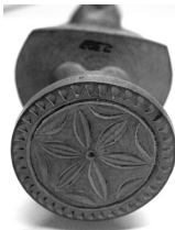
Detalle de la impronta

La impronta de la pieza está tallada en la misma madera, a diferencia de otros sellos de diferentes procedencias que utilizan el cuero o el asla en esta zona. La figura representa a una mujer con los brazos en jarras, aparentemente con el torso desnudo y ataviada con una falda relativamente corta que en su vuelo, longitud y marcas de los pliegues del perímetro se asemeja mucho a las mantillas del traje femenino de Monthermoso; así mismo, el peinado con que está tocada ha sido acertadamente relacionado con el popular “moño de picaporte” que era propio de nuestra provincia. El delantal, por su parte, se adorna con motivos geométricos y roleos, que alternan con un motivo vegetal y una cruz, tan frecuente en las distintas manifestaciones estéticas de origen artesanal.