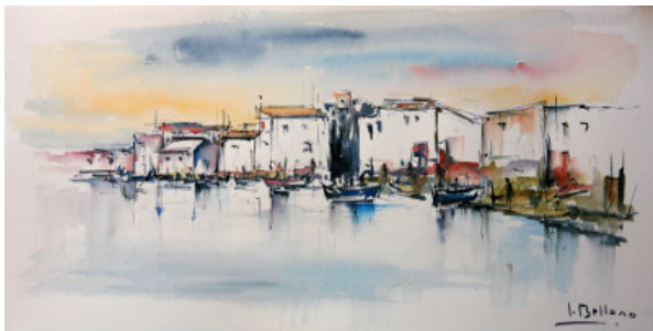
Obra de Isidro Belloso