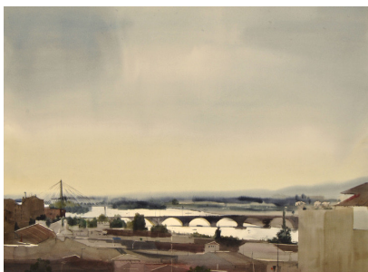
Obra de Federico Plasencia

El visitante podrá apreciar en esta exposición las posibilidades expresivas que la acuarela ofrece.