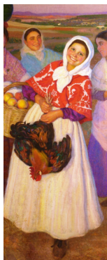
E. Hermoso. A la fiesta del pueblo (detalle)

Seminario Pintoresco Español, 24 de Enero de 1847