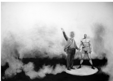
Sueño y mentira de América