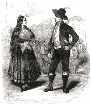
UNA BODA EN CARRASCALEJO.

El pañuelo tomatero o de sandía es una prenda ligera, vistosa y barata ligada al traje de faena o labranza; estampado sobre percal (tejido de algodón), a veces se colocaba bajo el mantón de Manila u otro pañuelo de gala para darle mayor vistosidad. Los motivos decorativos que más se utilizan son los floreos o geométricos en rojo sobre fondo blanco, aunque también son frecuentes a la inversa, tomando sus dos denominaciones principales de ese predominio del color encarnado; así mismo se pueden encontrar con una decoración en negro o azul sobre fondo blanco y en dorado sobre fondo rojo. Aunque se les ha denominado de tipo francés, parece que en su origen eran importados de Suiza, y después pasaron a ser fabricados en