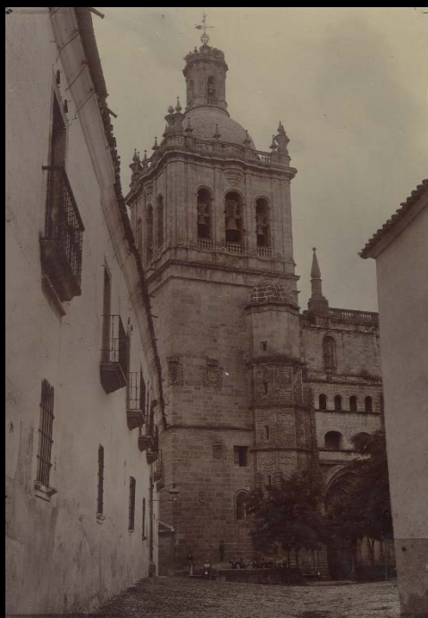
Fachada y torre de la Catedral de Coria, fotografía de Julián Peraté, ca. 1920. (Archivo fotográfico del Museo de Cáceres)