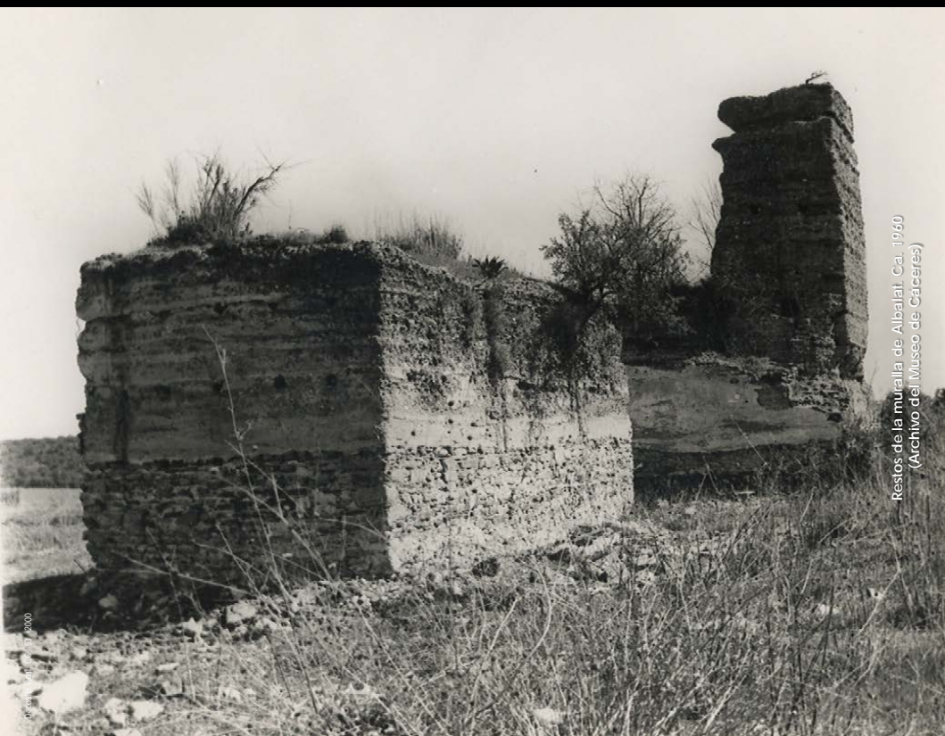
Restos de la muralla de Albalat. Cal. 1960