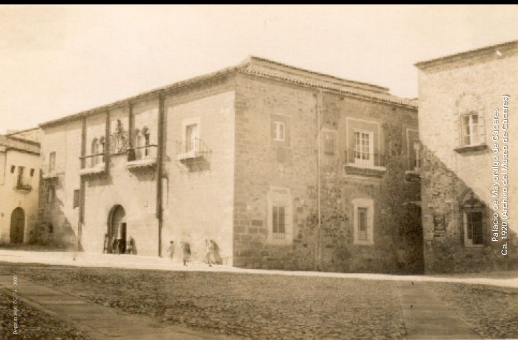
Palacio de Mayoralgo de Cáceres. Ca. 1920