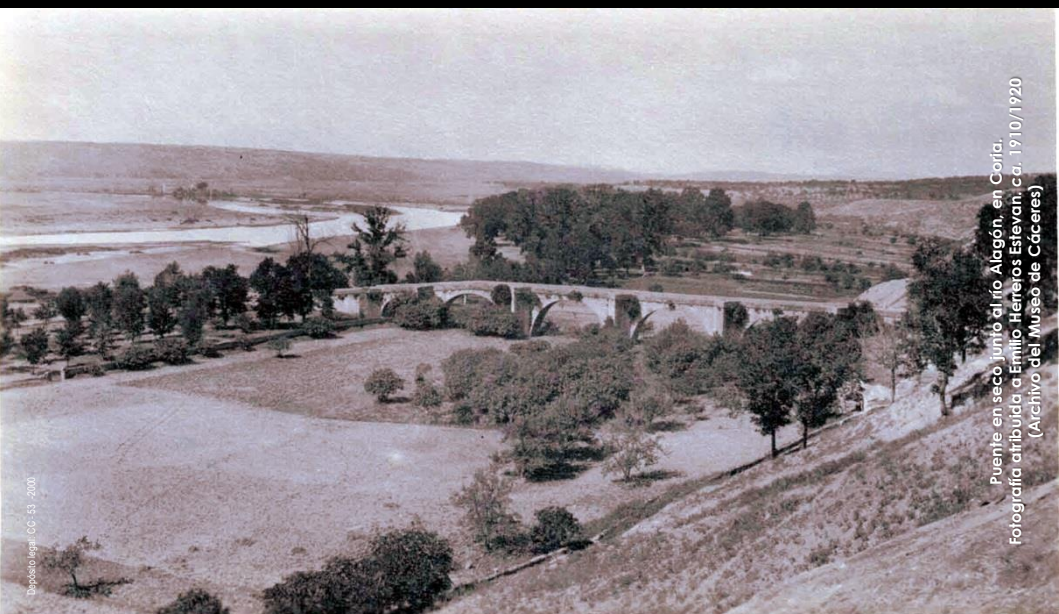
Puente en seco junto al río Alagón, en Coría. Fotografía atribuida a Emilio Herrerías Estevan, ca. 1910/1920 (Archivo del Museo de Cáceres)