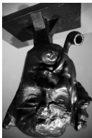
№ 91. Octubre de 2008

extremadura ESTACIONCULTURA JUNTA DE EXTREMADURA Museo de Cáceres Pza. Veletas, 1 10003 Cáceres