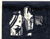
"Las aventuras del príncipe Achmed"

El dibujo elegido forma parte de un artículo titulado "Sobre el dibujo en el cine", y reproduce un fotograma de la película Las aventuras del príncipe Achmed realizada a base de siluetas en movimiento, entre 1923 y 1926, por la animadora alemana Lotte Reiniger. Se