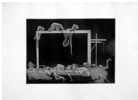
"La peste", Gastón Orellana

Se trata, pues, de artistas actuales, en plena actividad, y la mayoría extremeños y portugueses, ya que el Museo de Cáceres mantiene una estrecha relación con este país. A través de este conjunto de obras, algunos artistas inauguran su presencia en los fondos del Museo de Cáceres, mientras que otros la refuerzan y enriquecen con una destacable variedad de técnicas presentes en este conjunto, que cuenta con pintura, fotografía, grabado y escultura.