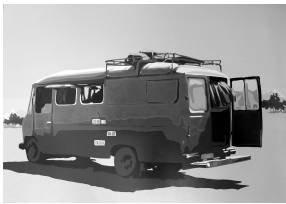
"On the road again", Abigail Navárez

De Martes a Sábados, de 9:00 a 14:30. Domingos de 10:15 a 14:30 horas. Cerrado los lunes