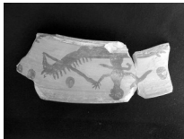
Nº 80, Octubre de 2007