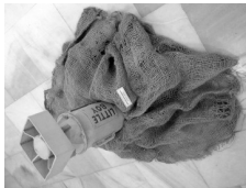
Nº 53 Abril de 2005

Plaza de las Veletas, 1 10003 Cáceres Horario de apertura: Martes sábados 9,00 - 14,30 y 17,00 - 20,15 Domingos: 10,15 - 14,30 Teléfono: +34 927 01 08 77 Fax: +34 927 01 08 78 http://www.museodecaceres.com/caceres e-mail: museocaceres@ccj.unex.es