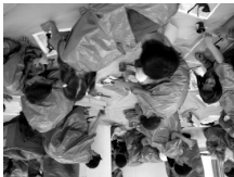
№ 32, Febrero de 2003