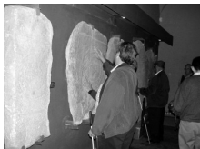
Museo abierto. Visita de un grupo de invidentes

Como cada año, el 18 de Mayo nos trae una nueva edición del Día Internacional del Museo, cuya celebración constituye, sin duda, la gran Fiesta Mayor de la Museología mundial. ICOM fue el creador de esta iniciativa en 1977, y desde entonces lo mantiene y promueve para hacer llegar su mensaje tanto al público general, como a los profesionales de la comunidad museística internacional, miembros o no del ICOM. Para