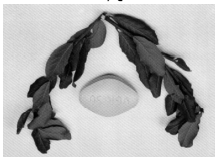
19 Diciembre de 2001

MUSEO DE CÁCERES Noticias del Museo de Cáceres