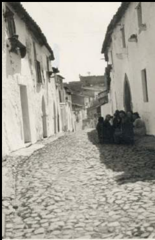
Calle de Valencia de Alcántara. ca. 1950.