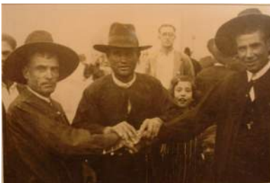
El trato. Fotografía de Pesini (Zafra, 1931)

XXI, pone de manifiesto la actualidad y la permanente evolución e investigación dentro del género fotográfico, presente en todas las ferias de arte contemporáneo y patente en la gran cantidad de certámenes nacionales e internacionales. Así mismo, el interés y la necesidad de conservar las numerosas colecciones fotográficas custodiadas por museos, archivos, bibliotecas y