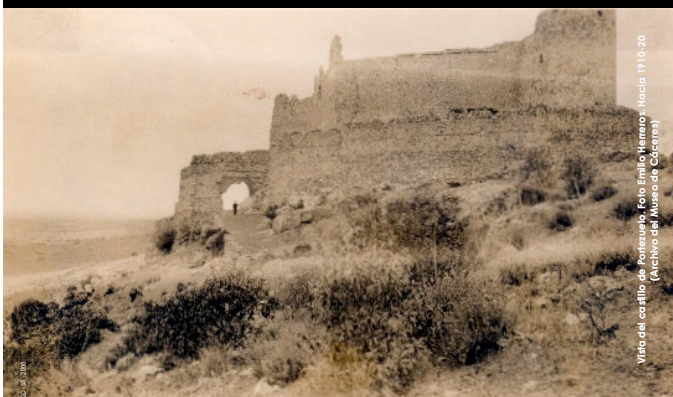
Vista del castiello de Fontevieja. Hacia 1910-20