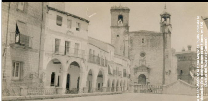
Iglesia de San Martín en la Plaza Mayor de Trujillo, antes de la colocación de la estatua ecuestre de Pizarro, en 1929