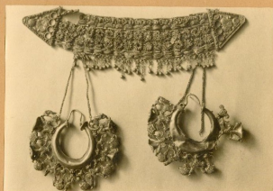
Del tesoro femenino de Aliseda