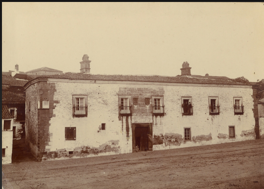
Fachada principal de la Casa de los Marqueses de Torreorgaz en Alcántara. (Fot. Perale, Archivo del Museo de Cáceres. 1902)