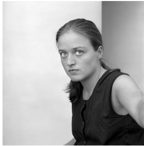
A working class hero

La exposición se convierte así en una antológica que celebra la madurez artística alcanzada por Bárbara Allende Gil de Biedma, nombre real de Ouka Leele, después de tres décadas de trabajo. Las imágenes escogidas, que reflejan su dominio técnico y su constante creatividad, son una perfecta síntesis para entender las diferentes etapas de la fotógrafa: sus imágenes en blanco y negro, sus pioneras obras coloreadas y sus últimos trabajos donde asumió el punto de inflexión digital en la fotografía.