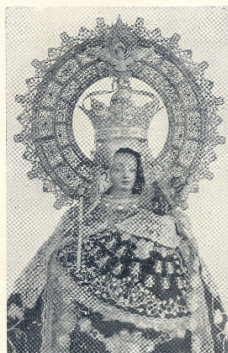
Ass. Virgen de la Montaña, Patrona de Cáceres

El libro que elegimos como pieza del mes fue donado a la biblioteca del Museo de Cáceres por su autor, en la época en que fue Director.