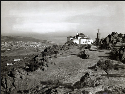
Vista del Santuario de la Virgen de la Montaña (Cáceres) antes de la construcción de la Casa de Ejercicios Espirituales (ca. 1749).