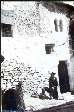
Casa imatocai que hubo en la Calle Amargura de Cáceres. Fue derribada en 1908. Fotografía de Gabriel Liabrés, donada al Museo en 1910 (Archivo del Museo de Cáceres)

e-mail: museocaceres@juntaextremadura.net