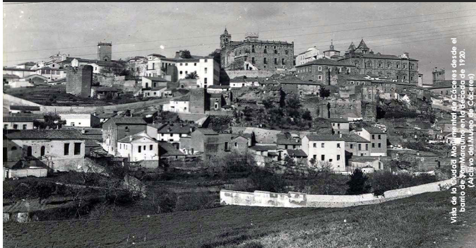
Viso de la Ciudad Nocturna de Cáceres desde el barrio de San Marcos en el mes de agosto de 1920.

e-mail: museocaceres@juntaextremadura.net