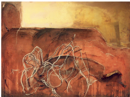
Isaac Cardoso (Serie Siberia extremeña a.). Wolf Vostell. 180 x 240 cm. Colección estable del Museo de Cáceres

Promovida por el Consorcio Cáceres 2016, entre Julio y Septiembre de 2010, el Museo de Cáceres exhibirá la exposición "Arte en la intimidad. Obras de Vostell en Cáceres (1958-1998)". Se trata de una selección de obras de Wolf Vostell (Leverkusen, 1932 – Berlín, 1998) que revelan la relación del artista con la ciudad de Cáceres. La muestra cubre el período temporal durante el cual estuvo