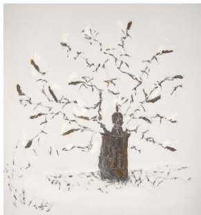
Castiñeiro de Riazar. Paloma Souto, 170 x 170 cm.

Por otro lado, Souto se vale del sentido de misterio propio de cualquier tipo de gruta o caverna que tiene el aljibe, y realiza una proyección sobre la superficie del agua de una reproducción de la Ofelia pintada por Millet y de una laguna rodeada por los abedules del bosque de su infancia.