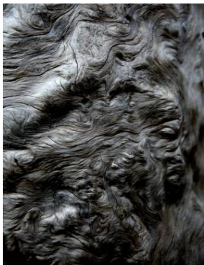
Fotografía de Andrés H. Zuazo, 105 x 110 cm.