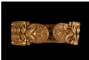
Brazalete del Tesoro de Aliseda. Época Orientalizante

La exposición ha podido verse en Cáceres desde el pasado 15 de Enero gracias a la colaboración acordada entre la Consejería de Cultura y Turismo de la Junta de Extremadura y el Ministerio de Cultura, y supone una oportunidad única para contemplar piezas señeras de la orfebrería peninsular, entre las que destacan piezas extremeñas como un brazalete del célebre Tesoro de Aliseda, los torques de Berzocana, una de las estelas decoradas de Hernán Pérez o los torques de Bodonal de la Sierra.