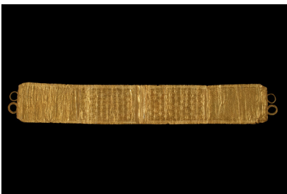
Diadema / cinturón de Vega de Ribadeo (Asturias). Cultura castreña, siglos III-I a. C.

La exposición llega a Cáceres gracias a la colaboración acordada entre la Consejería de Cultura y Turismo de la Junta de Extremadura y el Ministerio de Cultura, y supone una oportunidad única para contemplar piezas señeras de la orfebrería peninsular, entre las que destacan piezas extremeñas como un brazalete del célebre Tesoro de Aliseda, los torques de Berzocana, una de las estelas decoradas de Hernán Pérez o los torques de Bodonal de la Sierra.