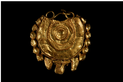
Amacoda de Madrigalejo (Cáceres). Orientalizante, siglos V-IV a. C.

La exposición llega a Cáceres gracias a la colaboración acordada entre la Consejería de Cultura y Turismo de la Junta de Extremadura y el Ministerio de Cultura, y supone una oportunidad única para contemplar piezas señeras de la orfebrería peninsular, entre las que destacan piezas extremeñas como un brazalete del célebre Tesoro de Aliseda, los torques de Berzocana, una de las estelas decoradas de Hernán Pérez o los torques de Bodonal de la Sierra.