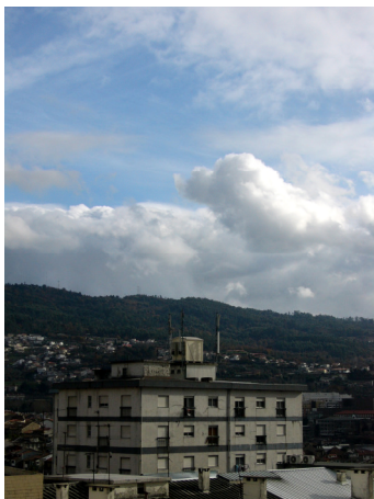
Luís Ribeiro. "Invisible invaders" (2008) Fotografía Digital, 97x70cm

Es imperativo que me justifique cuando defino a los Artistas como alquimistas. Además, permítanme añadir, doblemente alquimistas.