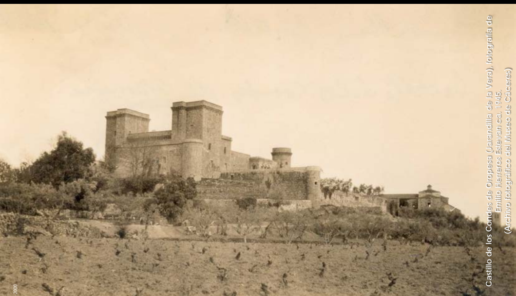
Castillo de los Condes de Oropesa (Jurisdicción de la Vera), fotografía de Emilio Herreros Estevan ca. 1945. (Archivo fotográfico del Museo de Cáceres)