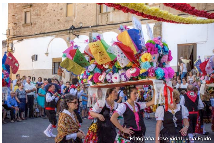
Fotografía: José Vidal Lucía Egido