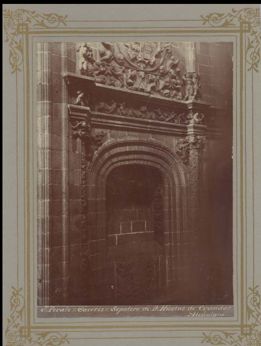
Perate - Cáceres - Sepulchro de D. Nicolás de Ovando - Alcántara

Sepulchro del gobernador de las Indias Frey Nicolás de Ovando, en el conventual de San Benito (Alcántara). Fotografía de Julián Perate, ca. 1920. (Archivo fotográfico del Museo de Cáceres)