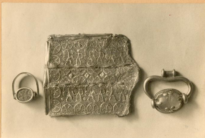
Del tesoro fenicio de Aliseda.