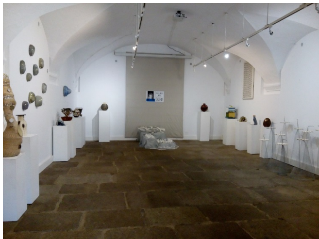
Una vista de la exposición «Con barro 2019»

De nuevo, el Museo acoge la exposición «Con barro», ya por tercer año consecutivo, que muestra una selección de los trabajos llevados a cabo durante el curso académico por el alumnado del Taller de Cerámica (turno de tarde) de la Escuela de Bellas Artes «Eulogio Blasco» de la Diputación Provincial de Cáceres.