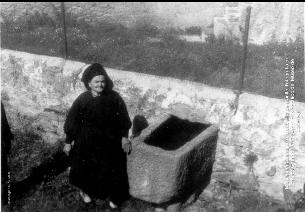
Montehermosa, junto a una pila de granito. Fotografía de Lorenzo Garrido, 1977. (Archivo fotográfico del Museo de Cáceres)