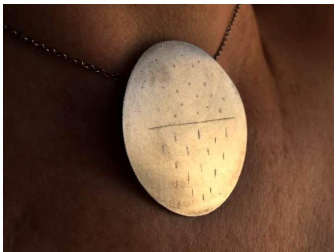
«Trece Arras»