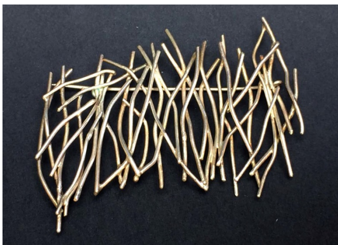
«Viento del oeste»

Se mueve en distintas disciplinas (pintura, dibujo, grabado, instalación), y ahora también colabora en la creación de joyas.