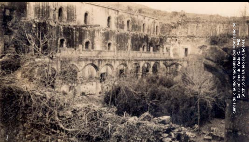
Ruinas del claustro renacentista del Monasterio de San Jerónimo de Yuste. Ca. 1940